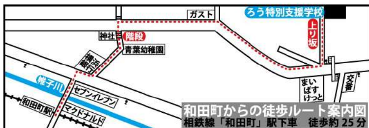
和田町からの徒歩ルート案内図 相鉄線「和田町」駅下車 徒歩約25分