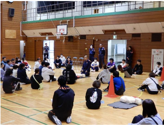
全体での研修の様子

緊急時には、救急車を要請・誘導する人、心臓マッサージを交代で行う複数人、周囲を囲ってプライバシーを守る役割の人、状況を記録する人など、多くの人が連携して救助にあたる必要があることを学びました。また、救急隊が到着するまで、心臓マッサージを絶やすことなく継続することの重要性について教えていただきました。