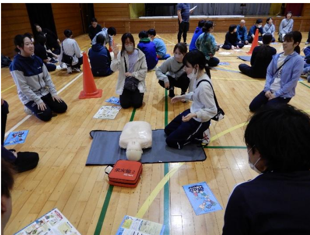
意識の確認、呼びかけます