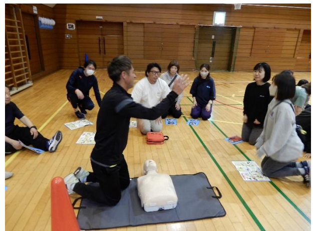
協力依頼をしています