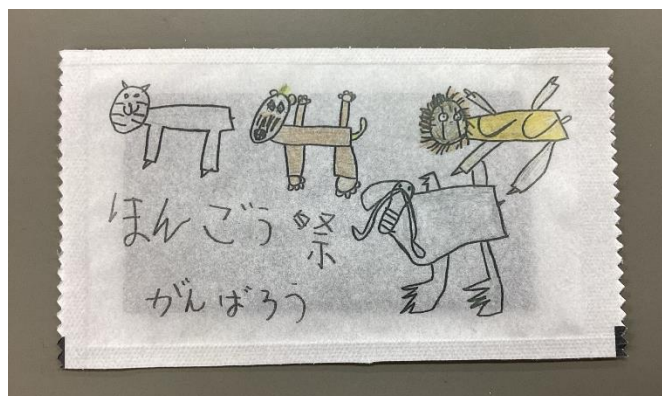
素敵なイラストの焼きのりの袋

素敵なイラストを描いてくれた集会委員の高等部3年生の生徒の「最後のほんごう祭を成功させたい」という熱い思いが、全校のみんなにしっかりと届きました。