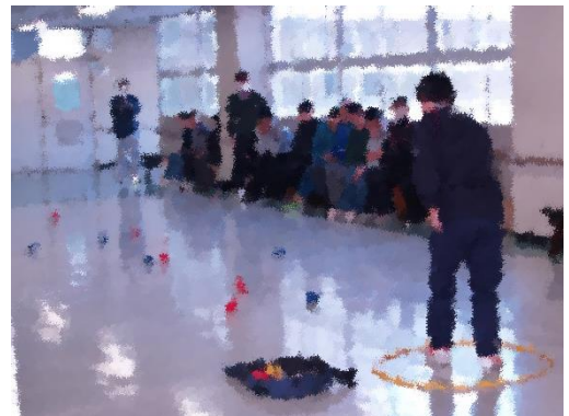
学年勢ぞろいでポッチャ大会