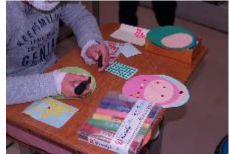
オリジナルだるまを作成中。