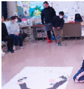
ポッチャをアレンジした、難易度アップの福笑い。 ボールが止まった場所に目や口のパーツが置かれる。