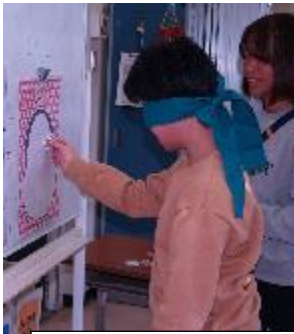
目隠しをしたりしなかったり。福笑いに挑戦中。