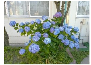
校庭の紫陽花がきれいに咲いています