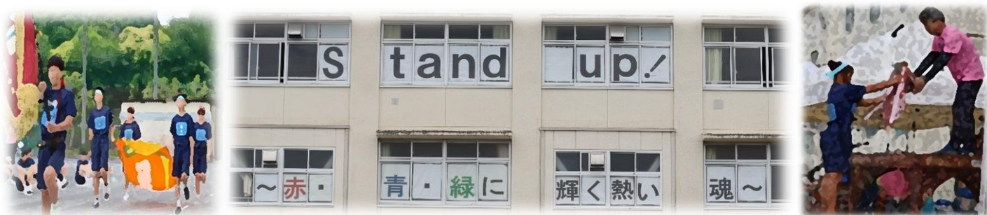
個人種目や学年種目での様子