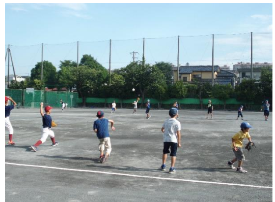
スポーツ文化教室