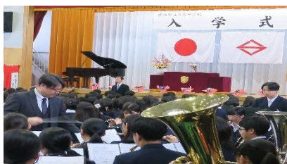
↑入学式・吹奏楽部演奏 離任式・退場→

最後に「いじめ予防」。昨年度、「いじめ防止基本方針改定版」を作成し、1年生は紙での配布と生徒指導部担当の先生から説明を行いました。また、「弁護士一斉道徳授業」を昨年度から始めました。これは継続が大事と考え、法的見地からのいじめについて学びを深めます。