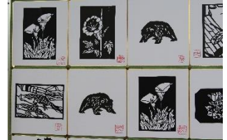
▲6組教室前廊下に展示中の「切り絵」