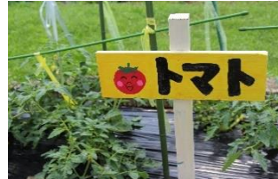
▲手作り看板「とまと」