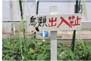
▲手作り鳥よけ看板「農園」