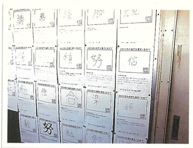
2023年の目標を漢字一文字で(2年生廊下掲示)

2年生の廊下には、「今年の目標」とする姿を漢字一文字で表して掲示してあります。どの目標にも設定理由が書かれており、生徒の皆さんが理想の自分をイメージしている様子が伝わってくるので、実に読みがいがあります。中学時代に身に付ける力は、人生で基礎力となります。だからこそ、この目標を決めただけで終わらせず、一步実行して、またさらに、実行力を継続する気概をもって心に留めて、この一年を進んでいってほしいと願いました。