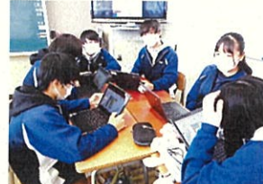
〔保体〕 端末活用での話し合い