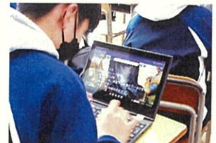
〔美術〕 絵画鑑賞の入力