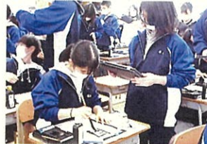
〔国語〕 書写を動画撮影