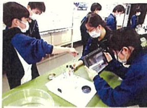
〔理科〕 実験を動画撮影

学校では、生徒に分かりやすく興味・関心が高まる授業になるよう、ICT 端末活用の授業を研究しています。校内研究会当日は、市教育委員会より3名の指導主事を講師に迎え、検討しました。