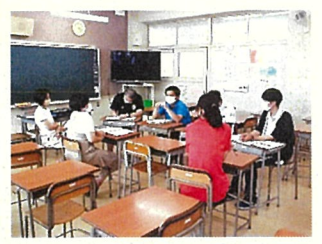
▲家庭分野:世界のだしを端末で調査 ▲英語:Today's goal(目標)は? ▲音楽:端末を使って振り返りを共有 ▲授業後の協議会「ICT活用」