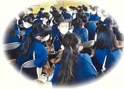
▲近くの仲間と積極的に話し合い

昨今の世界情勢等より、難民問題を身近に感じる中、着なくなった服がどのように「服のチカラ」を発揮し、難民に届くのか、意見を出し合い、発表し、自分たちにできることを考えました。