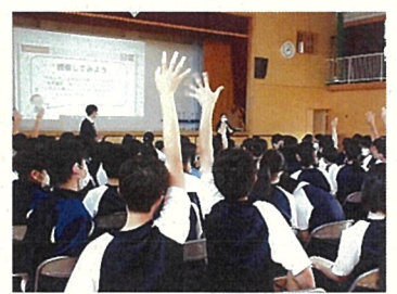
▲後ろの席からも高く手を挙げる発表意欲

私が着れなくなった洋服は、売るか、あげるか、捨てるかの3択だったのですが、今日の授業を受けて、今、私たちがすぐにできることは、着なくなった洋服を寄付することだと考えました。それによって、難民の人々が助かると思います。将来は世界中にいる難民が0人になって、皆が辛い思いをせずに、毎日が楽しく平和で幸せな世界になってほしいです。