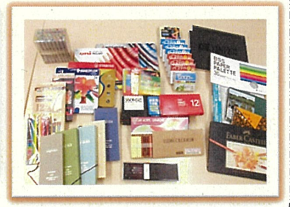
▲様々な画材に発想力が触発