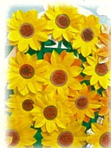
6組さんが作った素敵な向日葵

明日から、子どもたちが待ちに待った夏休みです。ただ残念なことに、新型コロナ感染がまた増加してきました。暑さとの闘いに感染症予防対策が加わり、悩ましい夏休みですが、授業中に比べ、ご自宅でゆったり、のんびり過ごす機会が増えるのが夏休みの良さです。どこか特別なところに行かなくてもいいのです。ご家族で他愛のない話をたくさんすると心がふれあい、満ち足りた夏休みとなります。大人にとっては相変わらず忙しい毎日でしょうが、心の健康づくりにどうかお力添えください。