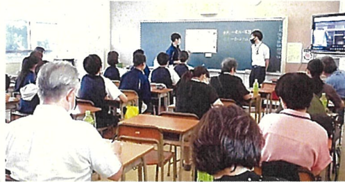
▲3年生も積極的に意見交流に参加しました。