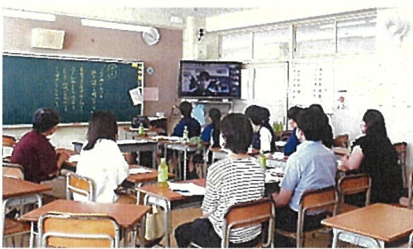
▲ICT機器を活用し、分散して開催しました。

今回の地区別懇談会にご参加して下さり、心より御礼申し上げます。今後とも風通しの良い地域連携を目指して、様々な活動に積極的に取り組んで参りたいと思えます。ありがとうございました。