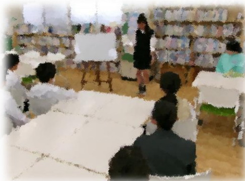
図書委員による読み聞かせ