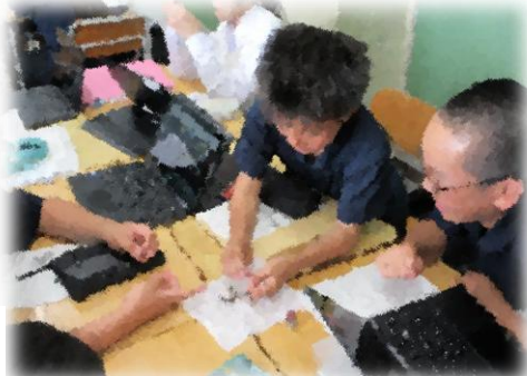
裸子植物の観察(理科)