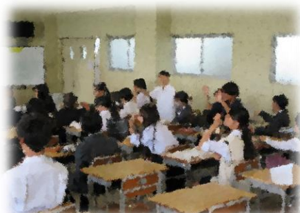
リコーダー演奏の様子(音楽)