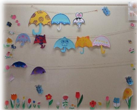
今月の美術部の作品

1年生と対象に5月15日に泉警察の署員の方を講師にSNSの利用について、講演がありました。とても便利なスマートフォンですが、メッセージによるトラブルや相手に求められ写真を安易に提供してしまうと、デジタルタトゥーとなってネット上に残り続けてしまいます。クリックをする前に、大丈夫かな?という冷静さが大切です。