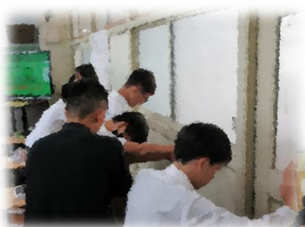
力のはたらき～壁が押し返す力 (理科)