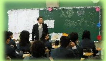
入学式後の新学活