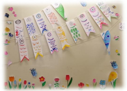
今月の美術部の作品