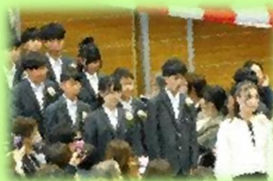
新入生入場のようす