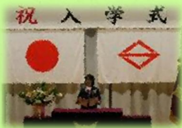
新入生誓いのことば