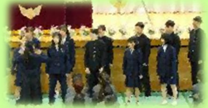
在校生からの校歌紹介