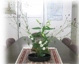
福沢美優さん作 校長室