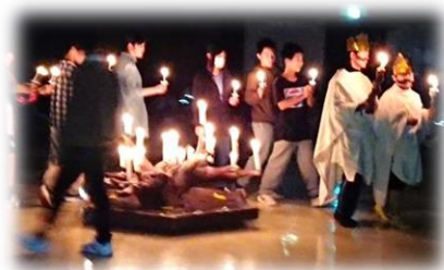
夜の集い(キャンドルファイヤー)

これらを通して、他校の生徒との交流を深めることができ、多くの体験をしました。また、校長先生は学校生活では見ることのできない、みんなの良いところをたくさん見つけることができました。