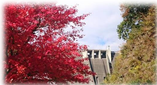
宮ヶ瀬ダムと紅葉