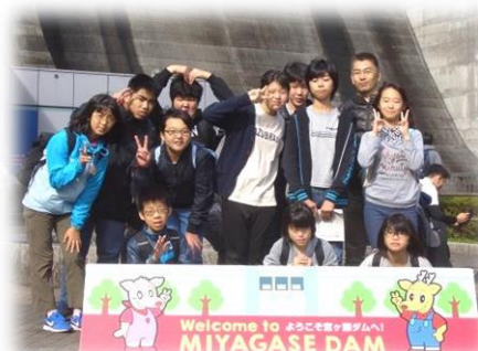
宮ヶ瀬ダムでの集合写真