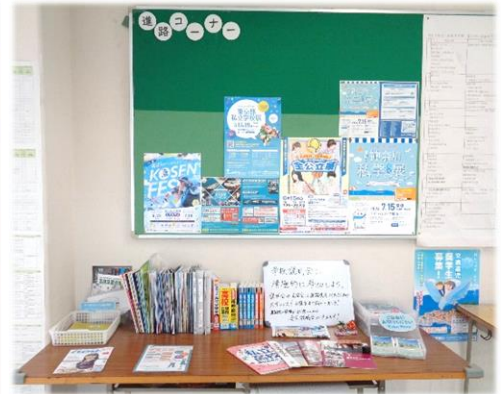
3 学年の廊下には 進路コーナーが設置されています