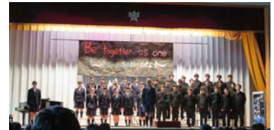
3年2組 IN TERRA PAX