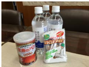
生徒一人分の非常用備蓄品

※ 3年生の、鹿児島への修学旅行は、生徒や保護者の安心・安全を考慮して、6月28日(火)～30日(木)に延期しました。また、それに伴い、眼科検診(15日)、耳鼻科検診(23日)の日程を変更し、23日は体育大会の予備日としないこととしました。(予備日は、22日(水)と24日(金))