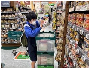
イトーヨーカドー