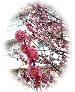
校舎そばの満開の紅梅

3年生の生徒の皆さんに是非とも聞いてみたかった質問2つを私から投げかけ、聞かせてもらった「3年生の声」をお届けします。成長期のみずみずしい感性にハッとさせられながら「声」を聞き、後輩の生徒の皆さんにも、これから西柴中学校で豊かな体験を重ねてほしいと感じさせられました。