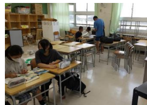
2年西柴タイム（社会）

9月9日（月）～11日（水）の放課後に「西柴タイム」が行われました。「西柴タイム」とは、定期テストの3日前から、教科の先生からポイントの説明があったり、少し不安な学習内容を教科の先生に質問したりする時間です。今回の「西柴タイム」では熱心に学習に取り組む生徒の様子をみることができました。そして、9月12日（木）、13日（金）には前期期末試験を行いました。みんな、とても真剣に取り組んでいました。