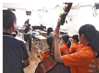
華やかに。楽しんで。 吹奏楽部