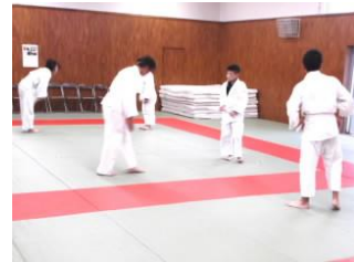
コロナに負けずに！ 柔道部