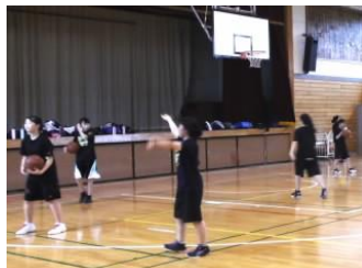
スピーディーに、力強く。 バスケットボール部