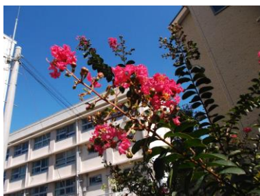
新棟裏の百日 紅。色鮮やかな 紅色の花を咲か せています。

引用元：インターネット花キュービット、静岡産業大学セミナー第1回「スポーツを科 学する」、カフェ「道みち」