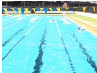
プールは友だち！ 水泳部