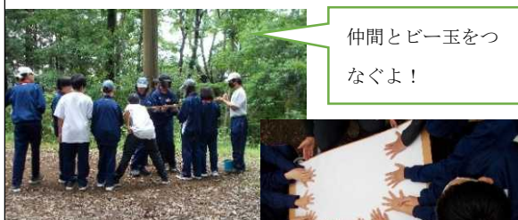
仲間とビー玉をつなぐよ！