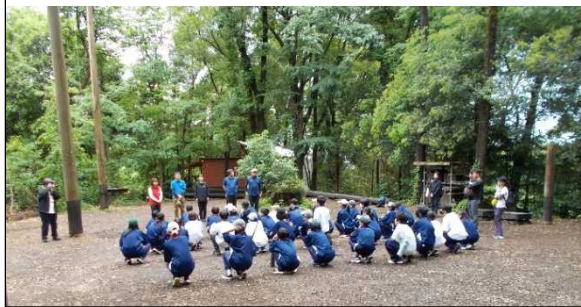
自然の中でスタートした PAA。よく話を聞いています。

当日までみんなが楽しめるようにがんばっていた実行委員、私たちが安全に楽しめるように下見などをしてくれた先生方、PAA でみんなが楽しめるようにしてくれたファシリテーターさん、ありがとうございました。