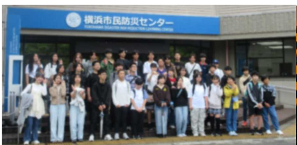
写真左：集合写真 中央：消火器訓練 写真右：地震シミュレーター

防災センターの体験・見学が終わった後は、みなとみらい地区へ移動して班別行動を行いました。防災の視点をもって、自分たちが調べたい場所へ移動して活動しました。昼食などは班で相談して決めたところで食べ、リラックスする時間をもつこともできました。