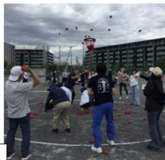
写真左:バラエティ走 中央:ソーラン節前に気合を入れる3年生 右:PTA 種目玉入れ

私は赤組実行委員長として、生徒全員の思い出に残るような体育祭にしたいと思い、選手宣誓をしました。練習では、宣誓のタイミングを合わせる事が難しかったですが、青組実行委員長と話し合い、呼吸のタイミングを意識するなど工夫して、本番で成功することができました。そして、赤組の仲間たちや、ライバルの青組、先生方や保護者の方と一緒に最高の体育祭にすることができ、とても嬉しかったです。