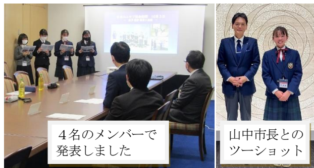
4名のメンバーで 発表しました