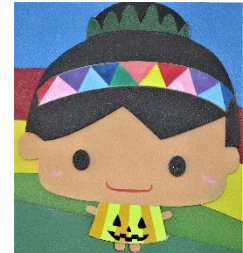
中川中スクールキャラクター 「みどりん」