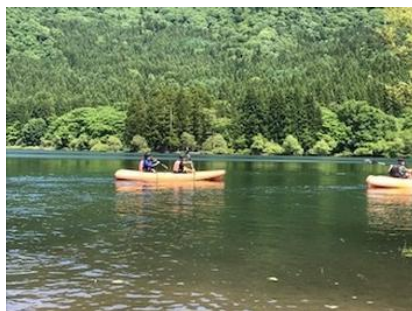
人気のカヌー体験

2年生は6月1日から2泊3日の日程で、長野県戸狩村にて自然教室を行いました。3日間とも天候に恵まれ、自然教室の写真は真っ青な空と濃い緑がとても印象的です。今回は戸狩村の民宿に分宿し、先生たちのもとを離れ、3日間、宿のお父さん、お母さんと生活をともにしました。教室とは違う自然の中での学習、宿の方とクラスの仲間との集団生活など、日常生活とは異なる生活の中で、たくさんの体験を行い、学び