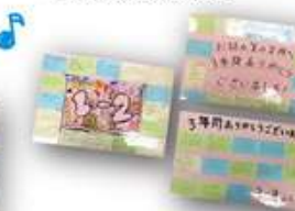
▲温かい言葉が溢れた卒業生からのメッセージ色紙！