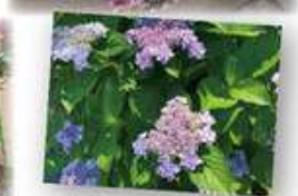
▲初夏にかけては美しいあじさいが楽しめました！