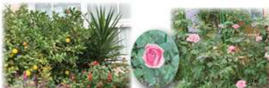
▲六中レモンもたわわに実りました♪ ▲職員玄関の「はまみらい」