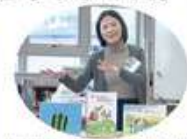
▲司書による読み聞かせ実演や選書のアドバイス

1月20日、近隣小学校で活動している読み聞かせボランティアが集まり、交流勉強会を開催。お招きした金沢図書館の司書さんに本の選書や読み聞かせの実演をしていただき、各校の情報共有もできて充実した時間となりました。