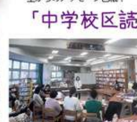
▲読み聞かせ講座の後の交流会では、自己紹介や各学校の活動内容など、活発な意見交換が行われました！