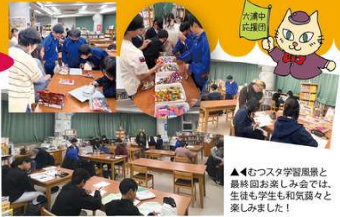
▲▲むつスタ学習風景と最終回お楽しみ会では、生徒も学生も和気藹々と楽しめました！

今年度は1年生～3年生まで33名が登録、参加。大学生や地域サポーターに分からないところを教えてもらったり、勉強の仕方などをアドバイスしてもらいながら、楽しく自学習に取り組みました！