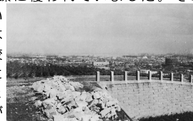
宮田より港方面を臨む(昭和 24 年頃)

さて、台風、ラグビーワールドカップ等の様々な話題が続き、瞬く間に10月に突入しました。おかげをもちまして、宮田中学校は17日（木）に『創立70周年記念式典』を開催することになりました。大きな式典ではありませんが、生徒と共に宮田中70年の歩みを振り返りながら、大切にされてきたもの、大切にしているものを再認識し、未来へつないでいきたいと思っております。機会がある度に触れてきましたが、宮田中を含め、新しい教育制度の下、義務教育の中学校（新制中学校）が誕生したのは、悲惨な戦争を二度と繰り返してはならないという「平和の願い」、新しい時代を切り拓いていこうという「希望」が原点であったと思います。74年前、この地は、空襲で焼け落ちた「旧宮田国民学校」の瓦礫に覆われていました。その4年後、戦後の混乱がまだ続き、昼食を用意することができない生徒が大半を占める「食べるものもままならぬ時代」に宮田中は開校しました。そして、昭和27年3月の第1回卒業式までに「校歌」、「校章」、「生徒会歌」が制定されています。PTAも創立と同時に設立されました。どれだけ多くの苦労があったことでしょうか。そのような歴史を知ること、これから皆さん一人ひとりが「平和を作っていく力」になるものと信じています。