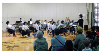
地区センター文化祭