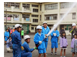
地域防災拠点訓練