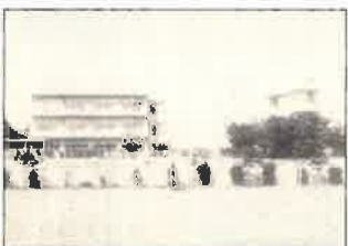
開校当時の南希中

南希中はどうやってできたのでしょうか。 皆さんも南希中の歴史が、どのように始まったのか気になりませんか。 そこで、南希中創立の歴史を調べてみました。 この学校が創立されたのは、一九七七年四月一日です。 校舎は、希望が丘中学校の校舎の一部と運動場に仮設した、プレハブ校舎を使用されました。 クラス数は全学年共に六クラス、計六百九十五人でした。 また、四月四日に開校式、翌日に入学式と始業式が行われ、南希中の歴史が始まりました。