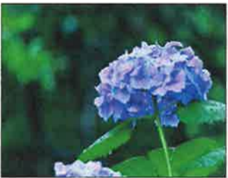
梅雨に咲くあじさい

梅雨の季節が近づいてきました。この時期は、突発的に雨が降り、湿度が多いというイメージがあります。今回はそんな梅雨について調べてきました。 まずは、梅雨の由来についてです。 「梅雨」に「梅」の字が使われている理由は中国にあるといわれています。 中国の揚子江周辺では梅の実が熟す頃が雨季にあたり、そのことから「梅」という字が使われるようになったそうです。 また、梅雨といえは湿度が高くジメジメしていて、カビも生えやすくなっています。 こういった梅雨に起こる問題の対処法も紹介したいと思います。 まず、基本は窓を開けて雨の日も換気をしましょう。室内は換気をする事で湿度を下げられます。さらに、梅雨に役立つ裏技も紹介します。