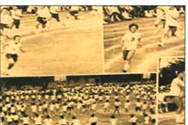
中学生時代の副校長先生

最後に、南希中生へ一言お願いすると「いつも笑顔をお忘れず、人のことを思いやる事が出来る優しい人でいてください。」とのことでした。