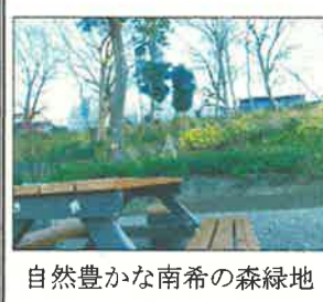
自然豊かな南希の森緑地