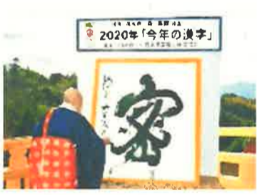
京都で発表されました

これには「新型コロナウ イルス防止策として「密」 (密閉・密接・密集)を避 けて行動するようになるな ど、日々の生活に大きな影 響を与えた一年だったから」 「リモート会議やオンライン での授業で人と離れてい ても「密」に人と関わるこ とができるようになったか ら」という理由でした。