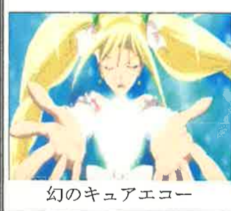
幻のキュアエコー