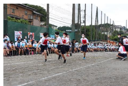
学年種目 全員リレー