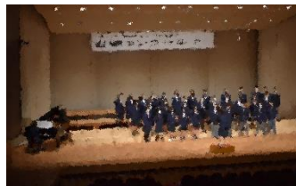
5組「変わらないもの」