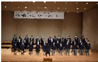
4組「今日から明日へ」