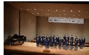
3組「未来へのステップ」