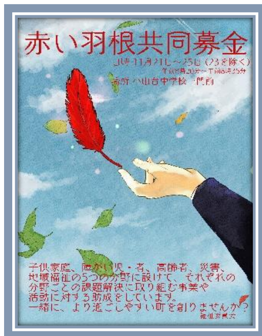
赤い羽根共同募金ポスター

今回の募金活動を通して学んだことをいかして、他にも自分たちにどのような活動ができるか生徒自身で模索しながら活動できる委員会を作っていってほしいと思います。