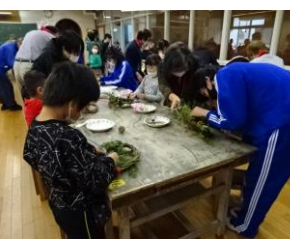
地域の方からの授業支援