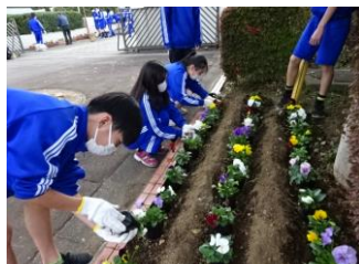
連合自治会からいただいた花を 美化委員が植栽