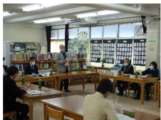
学校経営についてご意見をいただく 学校運営協議会

Connection between School, Home and Community