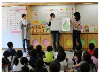
学習ボランティアによる読み聞かせ