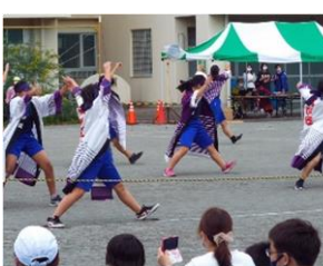
霧が丘大運動会でソーラン節を披露 する6年生(霧の里グラウンド)