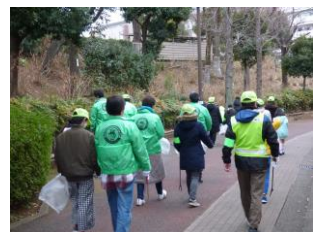
PTAによる防犯パトロール (児童生徒も参加)