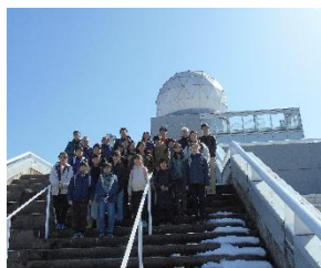
連合自治会主催の富士山リーダー ドーム見学に参加する児童