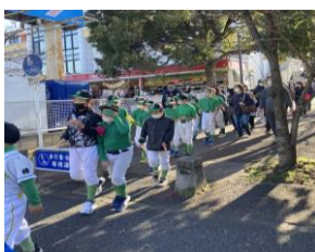
霧が丘スポーツ推進委員会主催の 「新春・歩こう会」(児童生徒も参加)