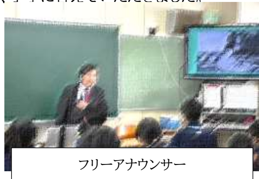
フリーアナウンサー

保護者の皆さまも機会を捉えて、中学生にご自身のお仕事についてお話いただくと良いのではないのでしょうか。これからの世の中で活躍する中学生に、「夢」や「希望」を感じ、語ることでできる「種」を多く蒔いておきたいと思いませんか。なにを自分の生活の糧とし、自己実現を図り、キャリア形成をするか…大人も考えることですね。