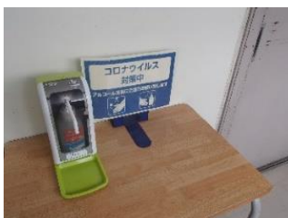
入口に自動の消毒液を設置