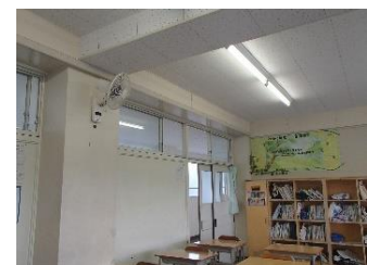
小型扇風機で空気を循環