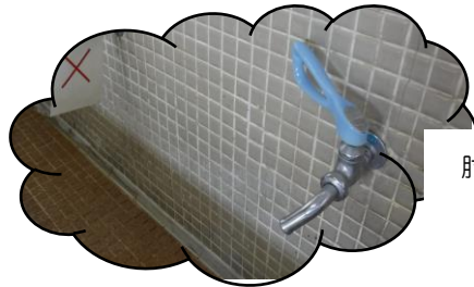
肘で操作できる蛇口

日頃より、感染症対策にご協力いただいている保護者のみなさま、地域のみなさまに心より感謝申し上げます。上白根中学校でも、昨年度から「新しい学校生活様式」を検討してきました。試行錯誤の連続だった昨年度に比べると、みなさんのご理解、ご協力のもと、少しずつ学校における日々の感染症対策は定着してきているように思います。しかし、まだまだ感染症の拡大が心配される状況は続いており、学校生活においてもさまざまな面で検討が必要なことには変わりはありません。大人も子どもも関係なく、どうしても「できない」ことに意識が向いてしまいがちな状況ですが、子どもたちには、どんな困難な状況も前向きに気持ちを切り替えて、自分のできることを精一杯やるという強さを身に付けていく機会だととらえて、指導を続けていきます。これからもご理解ご協力のほど、どうぞよろしくお願い致します。