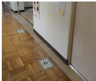
並ぶ時は、距離をとります。