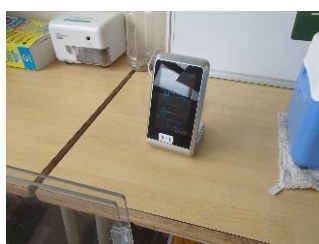
CO2濃度測定器で換気状態を確認