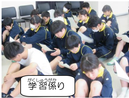
がくしゅうがが 学習係り

当日に向けて事前学習の様子です。全体でのオリエンテーションを受けて4月22日に係り別の会議をしました。班長・学習・広報それぞれの仕事内容の確認、委員長・副委員長などの組織作りをし教室に戻り班会議で各系の報告会をしました。