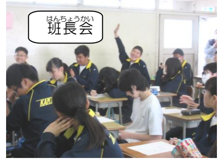
ほんちようかい 班長会

班長会では,[きまり・マナー・コース作り]について確認しました。高座渋谷でチェックを受け、高德院か鶴岡八幡宮でチェックを受けたあとの見学地と昼食場所を決めました。学習係は[学習ブック]をつくり,コース作りのための参考資料を作りました。広報係は遠足当日の様子を班新聞にするための準備として記事の分担とデザインを考えました。