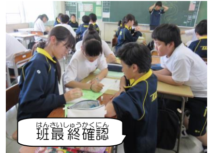
ほんさいしゅうかくにん 班最終確認