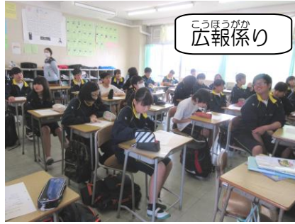
こうほうがが 広報係り