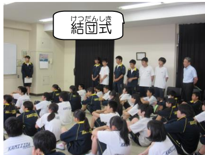
けつだんしき 結団式

結団式では各系の代表から「マナーを守りましょう,写真をたくさん撮りましょう,学習ブックを活用しましょう,学級委員長からは「協力して楽しみましょう」という話がありました。教室に戻り班の集合場所や,どんな遠足にしたいかと個人目標など最終確認をしました。当日の様子は次号をお楽しみしてください。