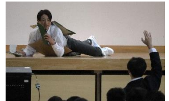
タートルトークを模した 今月のふわふわ言葉紹介

一人ひとりにもたくさんの発表の場があります。定められたテーマについて考え、自身の考えや調べたことを発表する活動が多く授業で行われています。言葉を巧みに駆使する、グラフや表を利用して分かりやすくするなど、教科の特長を生かした様々な手法を学んでいます。授業以外でもたくさんの発表の場があります。全学年に校外行事がありますが終了後には個々が感じたことや学んだことをまとめ、全員が発表者を務める機会があります。地域貢献やSDGsについて取り組んだ各学年の探究の時間もその一つです。学級で一人ひとりが感想や提案を発表したのちに、代表者による学年の発表会も行われました。栄区ビブリオバトルの校内選考会も同様でした。