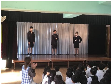
幼稚園での自己紹介

今年度は、56か所の事業所で体験をさせていただくことができました。ご協力ありがとうございました。