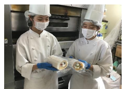
洋菓子づくり体験