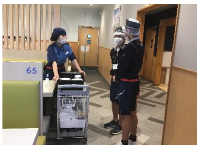
飲食店でのホール体験