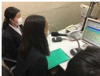
ラジオ局でのDJ体験