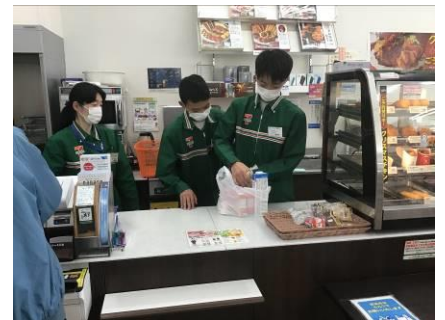
コンビニエンスストアのレジ体験