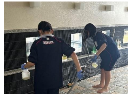
宿泊施設の浴室清掃