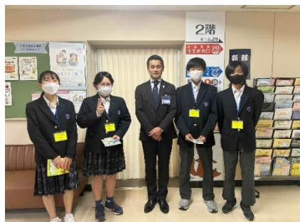
栄区長とのひとコマ