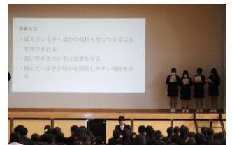
保健美化委員による 「健康について」の発表

コミュニケーションには、伝え手と聴き手の2つ立場があります。伝え手には、どんな言葉を使って表現し、話す内容をどのような順番で話せば相手に分かりやすくなるかなど「伝える力」が必要となります。また、聴き手になった時には、相手の話のポイントをつかんで自分の考えとの相違点を整理する、もしも違いがあった場合には、理由は何なのかを探るなどの「聴く力」が要求されます。