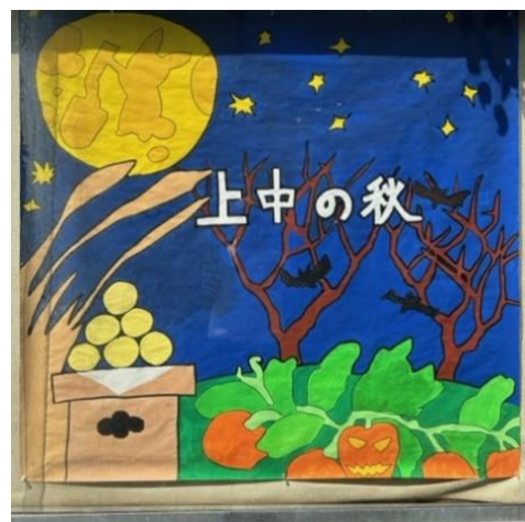
正門横掲示板を美術部の生徒が季節を彩ってくれています。

これからの一カ月間、試験や文化祭、英検や児童生徒交流日、新しい発見や気持ちを発散したり受け取ったり、そんな機会がたくさん待っています。充実した時間の過ごし方ができるよう祈っています。