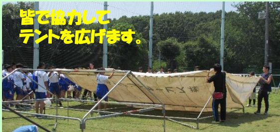
皆で協力してテントを広げます。