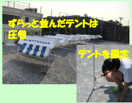
ずらっと並んだテントは圧巻