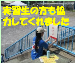
実習生の方も協力してくれました