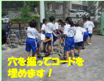
穴を掘ってコードを埋めます!

広報委員は3年生が主導して機材の準備をします。当日はアナウンスもあるので大活躍です。機材のコードは引っかけられないように穴を掘ってみんなで埋めます。