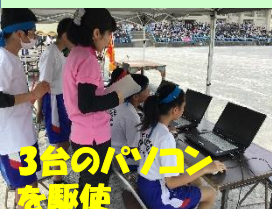
3台のパソコンを駆使