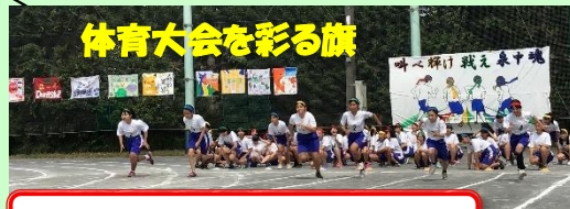
体育大会を彩る旗

泉が丘中学校の体育大会の素敵などころのひとつは、応援の良さです。暑くて疲れる中、自分の競技が無い時は、クラスの仲間やさらには他の学年の生徒の応援も一生懸命行っています。そうした温かい気持ちで体育大会を盛り上げているように思います。もちろん、競技を終えて、疲れて戻ってきた生徒や、活躍した生徒に対するねぎらいの言葉も忘れません。体育大会はスポーツとしてだけでなく、ひとつのものを協力して作り上げていく過程に魅力があるのだと感じさせられた1日でした。