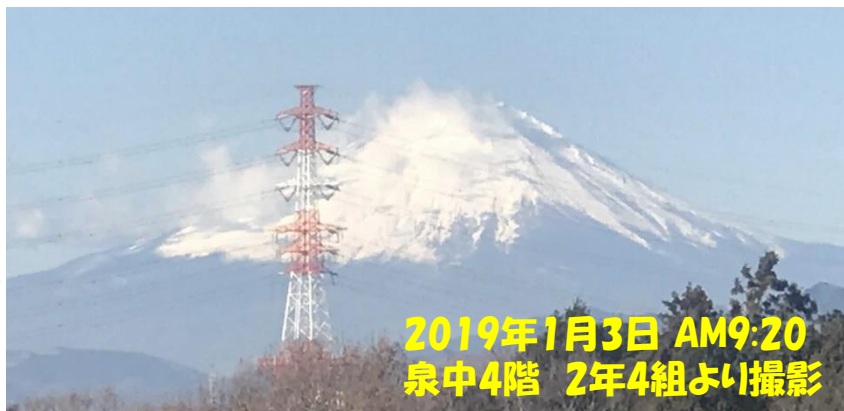
2019年1月3日 AM9:20 泉中4階 2年4組より撮影

新年が明け、典型的な冬型の気候。関東は天気は良いですが、例年以上に、寒く感じます。昨年夏の猛暑、酷暑と騒がれた事が嘘のよう。インフルエンザに罹患する生徒も少し増えてきました。受験を控えた中3生にとっては、大切な時期。ご注意くださいと思います。