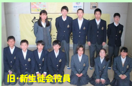
旧・新生徒会役員