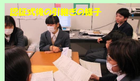
認証式後の引継ぎの様子

いよいよ、新しい生徒会役員による泉中づくりが始まります。昨年の生徒会役員も、とても大変でしたが、今年も様々なことに取り組んでいく予定なので、目まぐるしく1年が過ぎていくような気がします。エネルギーにもものごとを進めていくことができる子どもたちなので、頼もしく感じています。今年もみんなで頑張りましょう!