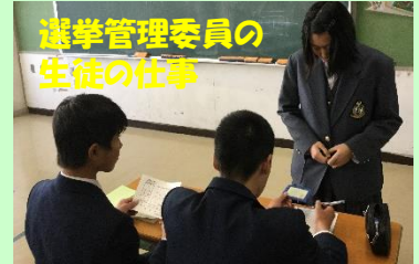
選挙管理委員の生徒の仕事