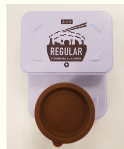
アレルギー代替食専用容器(青色)