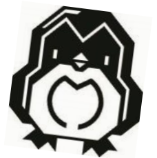
チーム青学年職員！生徒の元気に負けずに頑張っています！