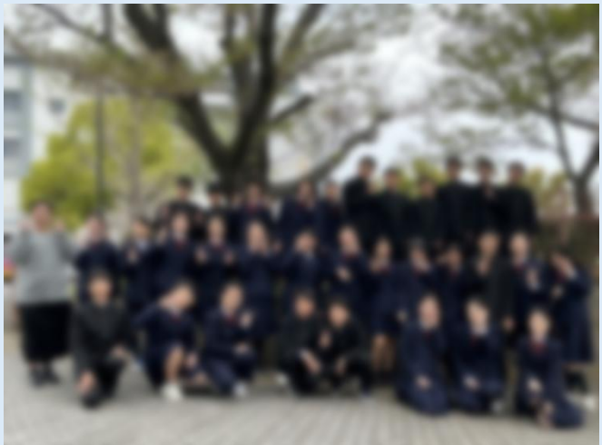
2-4集合写真。「MAYUMI クエストIV」達成に向けて、1年間頑張っていきましょう!いつだってほっこりしながら!