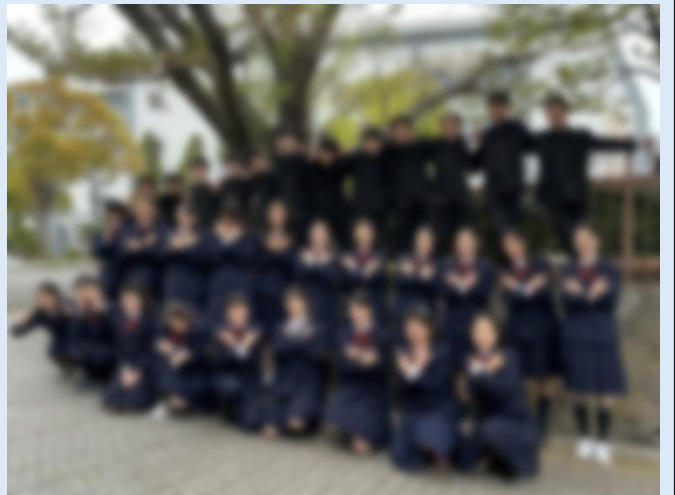
2-2集合写真。「み2ばち」達成に向けてチームワークを高めていこう！

クラスが始まって今は、まだ少し男女間の仲に隔たりがありますが、同性どうしの仲はとても良く、個性が出ていることは良い面です。しかし、週プランの提出率が悪いことや、リアクションが激うすなので、もう少し上げていきたいなあと思っています。僕は、もっと男女間の仲を良くして、みんな楽しく笑っていける毎日を過ごせるようなクラスにしていきたいです。学級委員は少し面倒くさいなど、最初は思っていました。徐々にやりがいを感じてきています！これから1年間精一杯頑張ります！私は、今年学級委員として2年目なので、クラスの皆さんを支えるのはもちろんのこと、同じ委員会の仲間のことも支えるという目標を持ち、1年間がんばります!!