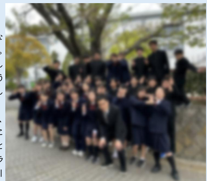
2-5集合写真。「大熱狂ニコニコブラザーズ」達成に向け仲良くいこう!