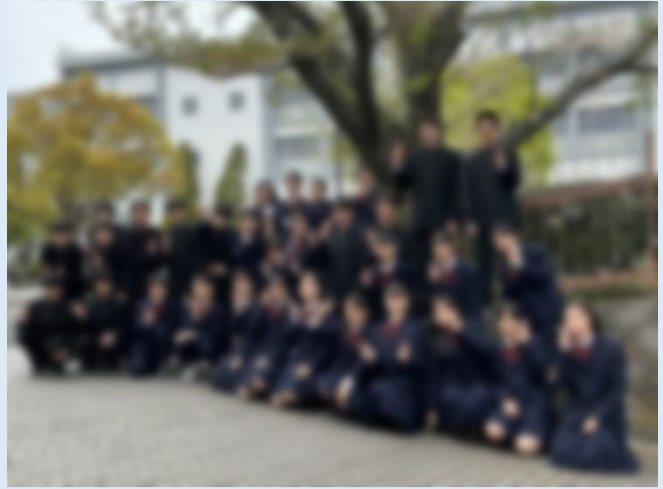
2-3集合写真。「あかざ」達成に向けて、一人ひとりがトップを目指せ!

3組は始まってから少ししか経っていないにも関わらず、全員が仲良く、話し合いのときも活発でとても良いスタートを切れました。私たちは、2人とも学級委員に今回初めて挑戦します。初めてだからこそその視点を大切にしつつ、早く学級委員の仕事に慣れ、クラスのみんなを支えられるような存在になりたいです。私たち2人が持っている強みである明るさや観察眼を活かして、より明るく良いクラスにしていきたいです。全員が持っている良さを高め合い、認め合える学年にするために頑張っていきます!!