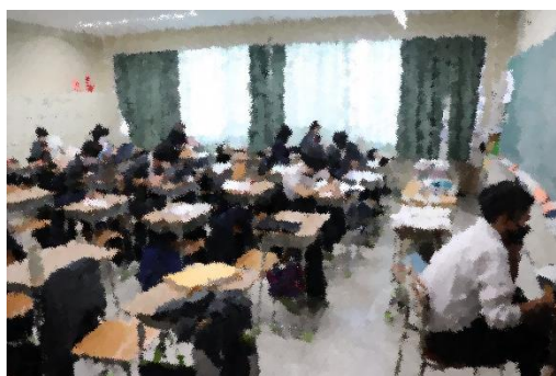
味のある手書きに拘る面々

論文執筆も佳境です。完成原稿の提出日は、1月7日(木)です。A4 用紙「20 枚」という千里の道も一歩から。前進あるのみです。頑張れ7期生！！