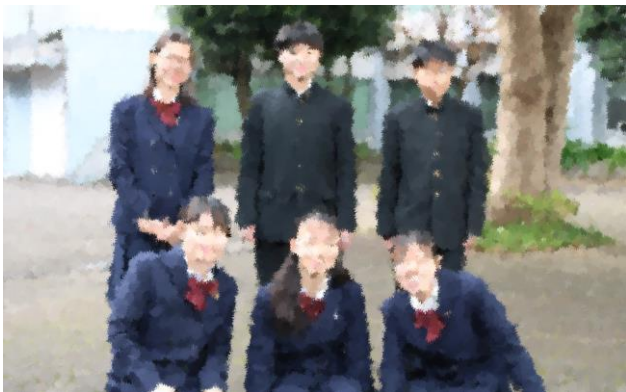
令和2年度 現生徒会本部役員のみなさん