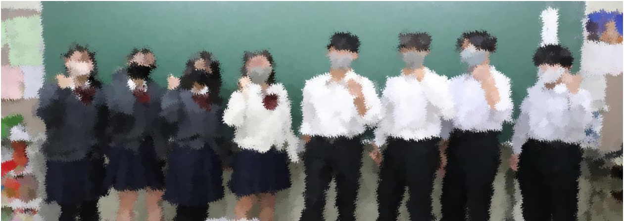
関西研修旅行実行委員

カナダに代わる研修旅行の行き先が京都・大阪に決定しました。まだまだ油断はできない状況ですが、研修旅行が思い出に残る充実した旅行になるよう関西研修旅行実行委員会が発足し、動き出しました。そこで、各クラスの実行委員さんが、どんな研修旅行にしていきたいか、思いを語ってくれましたので紹介したいと思います。