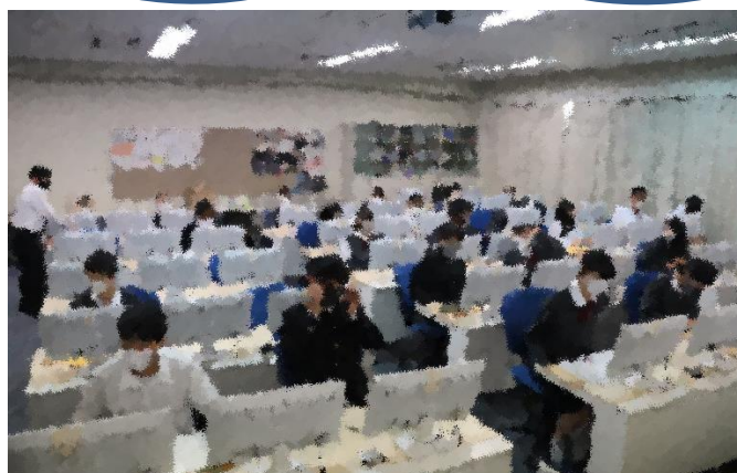
慣れない?パソコンと奮闘する人達

論文執筆も佳境です。完成原稿の提出日は、1月7日(木)です。A4 用紙「20 枚」という千里の道も一歩から。前進あるのみです。頑張れ7期生！！