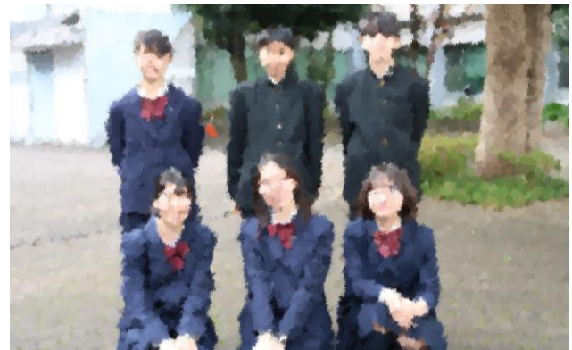
令和3年度 新生徒会本部役員のみなさん

今年度、生徒会本部は「伝える伝わる広げる言の葉 ～あなたも生徒会員の一人～」という生徒会目標を掲げて活動しています。この1年、新型コロナウイルス感染予防のために、生徒会活動がかなり制限されています。そのなかでも3学年の互いのつながりが少しでも感じられるようにと、部活動紹介ビデオを作成したり、例年のSLM（スマイルランチミーティング）に代わる活動を企画したりしています。12月から3月までの4カ月、現役員と新役員の10人がともに活動することで、生徒会本部活動の引継ぎとパワーアップとを目指していきます。