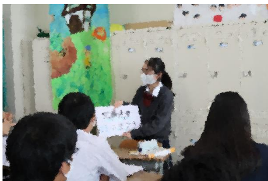
中間報告会の一コマ