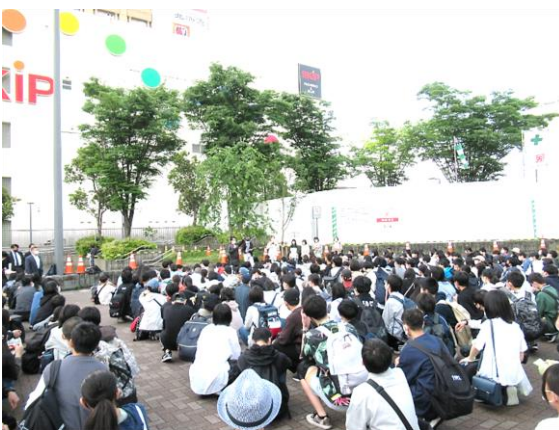
【出発式の様子（新横浜駅前広場）】