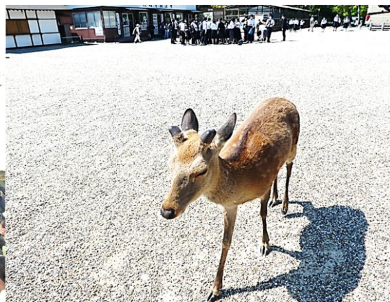
【ウェルカム鹿（興福寺五重塔付近）】