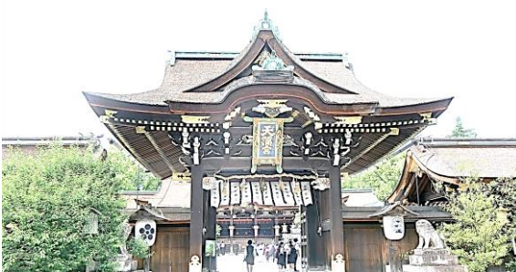
【合格祈願（北野天満宮）】