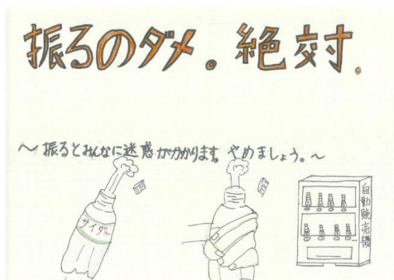
【1学年評議委員作成ポスター】 自動販売機周辺、廊下などに掲示