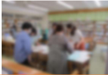
和気藹々の雰囲気です。