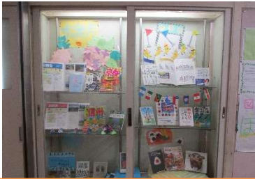
6月は体育祭と宿泊行事特集

廊下のショーケースや室内に季節やイベント合わせた本を並べたり、飾りつけをしてくださったりしています。昼休みになると大勢の生徒が図書館を訪れています。多くの生徒にとって読書がますます身近になることを祈っています。