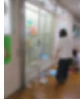
季節に合わせてレイアウト中