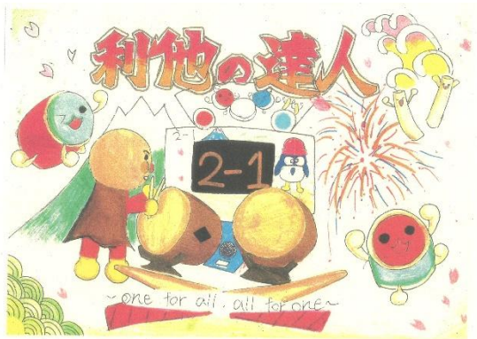
2-1:利他の達人～one for all, all for one～

各クラスで学級目標が決まりました。どのクラスも学年目標を念頭に置きながら、一人ひとりが意見を出し合い、言葉に込められた意味を深く考える中で話し合いを重ねてきました。その結果、それぞれのクラスの思いがしっかりと込められた目標を決めることができました。この目標の元、1年間かけて、素敵なクラスを創っていきましょう!