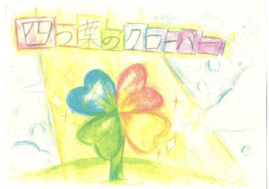
2-2:四つ葉のクローバー