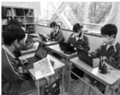
【コースづくりの様子】