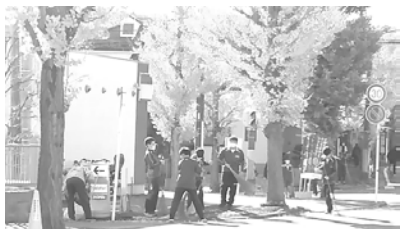
↑イチョウ並木の落ち葉掃きをする生徒

他の教科や領域、特に、理科、社会、技術家庭科、学級活動、総合的な学習、道徳との関連を図り、それぞれの教科等の充実に資するとともに、教育課程上の時数を調整、確保しています。