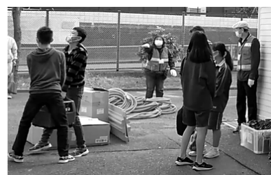
↑地域防災訓練で水揚ポンプを運ぶ生徒

小中合同の地域防災拠点訓練の他に、地域の一員としての自覚をもち、自分のできることを実践しようとする態度を育てるため、今年度は、2年生全員が1クラスずつ3日間に分けて、地域のイチョウ並木の落ち葉掃き活動に参加させていただきました。